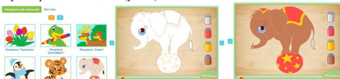
Рис. 4. Раскраска «Слоненок»

На сайте «Играемся» для детей предлагаются разнообразные раскраски-онлайн. Например, раскраска «Слоненок», на которой изображается цирковой артист – слоненок на шаре. Однако картинка незакончена, ее еще предстоит раскрасить. Вы говорите ребенку: «Постарайся сделать изображение ярким с помощью палитры с красками и волшебной кисточки. Щелкай мышкой сначала по баночке с краской, а затем по нужному участку на картинке. А разноцветный контур рисунка поможет тебе не запутаться и выбрать правильный цвет!» (рис. 4).