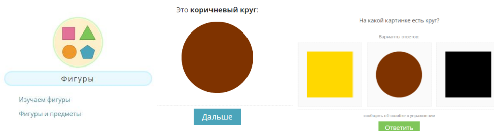
Рис. 3. «Изучаем фигуры»

В рубрике «Фигуры» предложены игры «Изучаем фигуры» и «Фигуры и предметы». Игра «Изучаем фигуры» ребенку предлагается рассмотреть круг, назвать его цвет. А затем нажимается «Дальше», и взрослый спрашивает: «На какой картинке есть круг?» (рис. 3)