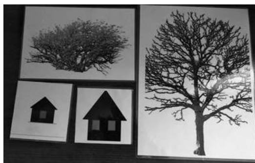
Рисунок 2 – Использование кодовых карточек

С помощью кодовых карточек и блоков обозначаю выделенные признаки (размер, форму, цвет и др.) при характеристике или сравнении объектов природы (дерево – кодовой карточкой, обозначающей большой размер, а куст, соответственно, символом, обозначающий маленький размер и т. д.).