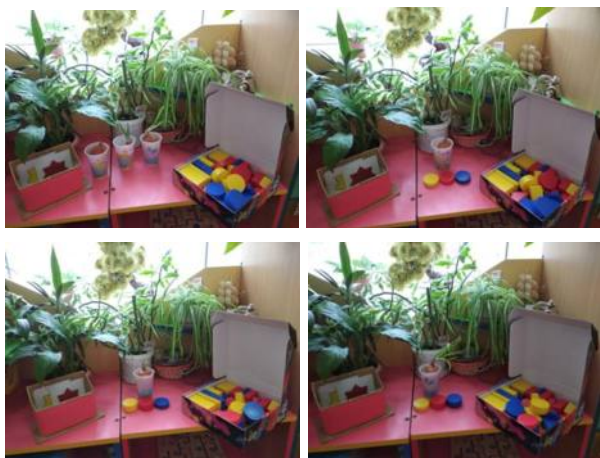
Рисунок 1 – Использование блоков, карточек-символов при наблюдении за животными и растениями

Использование блоков, карточек-символов при наблюдении за животными и растениями. Так при сравнительном наблюдении за ростом зеленого лука на подоконнике и зависимостью его развития от влаги, света и тепла, я ввожу условные обозначения: вода – синий круг, тепло – красный круг, свет – желтый круг; толстыми блоками обозначаем достаточное количество, а тонкими – ограниченное количество, света, влаги и тепла [4].